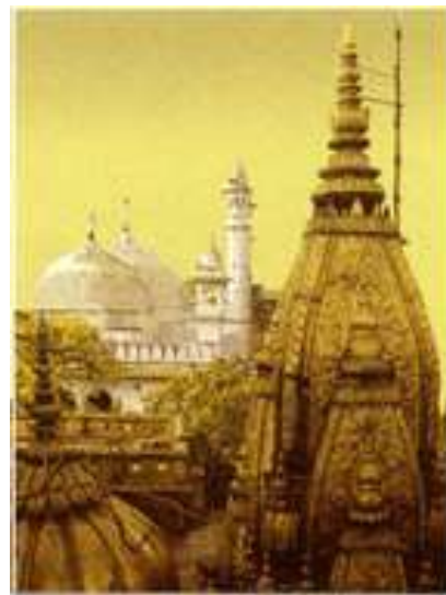
<写真：カーシ・ヴィシュヴァナート寺院。奥にギャンヴァービー礼拝堂。(門前町で売られているポストカード)>

上に記したように、この聖地は中世にアヨーデイヤやマトゥラーと同じように、ムガル帝国などムスリム勢力によって多大な被害を受けていることがわかる。バナーラスはヒンドゥー教三大神の一人で、退廃した宇宙を破壊し、宇宙創造の神であるブラフマー神に引き継ぐ「破壊の神」シヴァ神の聖地として知られる。その信仰の中心であるヴィシュヴァナート寺院は 12 世紀以降、何度も破壊された。特に 1669 年にはアウラングゼーブ皇帝の命により、当時のバナーラスの支配者がヴィシュヴァナート寺院を破壊し、そのレンガを利用してイスラームの礼拝堂を建立した。その一部には破壊しきれなかったヴィシュヴァナート寺院のレンガの壁が残っている。現在通称ゴールデ