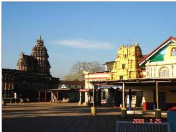
<写真③：シュリンゲーリ僧院 (右側の建物が、シャーラダー神を祀るシャーラダー寺院)>

シャンカラチャーリヤは、シャンカラ（初代のシャンカラ）から数えて、第36代目のバーラティー・ティールタが法主の座に就いている。シュリンゲーリ僧院の法主は、代々、シャンカラ派の信仰者ばかりでなく、インド全土のヒンドゥー教徒たちからも尊崇されてきた 3 。