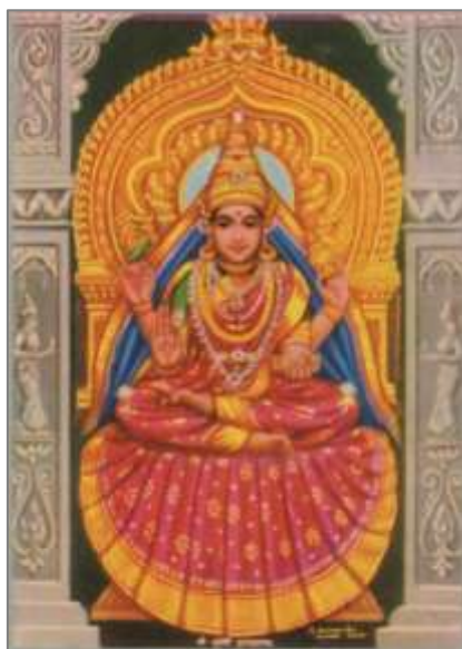
<写真②：母なる神シャーラダー神>

この学系は、中世以後、インド思想界で圧倒的な勢力を保持してきた。今日でも、パండిットと称する伝統的学者のうち、その大部分がヴェーダーンタ学徒であり、その八割以上がシャンカラ派に属していると言われて 2 。そのために、インドの知識人のあいだで、シャンカラの影響力は今もなお大きい。こうした経緯もあって、ヴェーダーンタ哲学といえば、特にシャンカラの名で広く知られてきたのである。