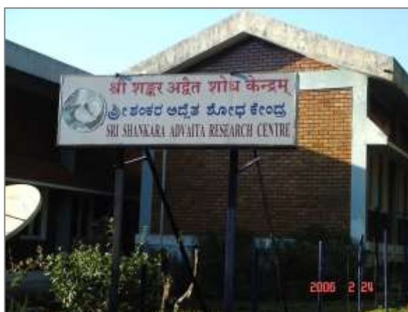
<写真④：シュリンゲーリ僧院の研究センター>

現代インド社会では、グローバリゼーションの波の中で、インターネットなどが普及し、人びとの生活様式が大きく変化してきた。それに伴って、今日、インドの宗教文化も大きく変容している。シャンカラ派総本山のシュリンゲーリ僧院も、独自の研究センターを設立してホームページを立ち上げるなど、インターネットを通じた情報発信などを積極的におこなっている。こうした目に見える変化にもかかわらず、シャンカラ派の伝統を貫くシャンカラチャーリヤ（世師）と信者のあいだの関係、すなわち「師と弟子の関係」の意味構造は変わっていない。つまり、シャンカラチャーリヤは、世俗を離れた少数の出家遊行者にとって模範的な聖者であり、在家の信者には呪術宗教的な力をもつ聖者として現世利益的な救いを与えている。こうしたシャンカラ派の具体的な信仰現象は、現代インドの生活文化を支えてきたインド的宗教性の一端を示していると言えるであろう。