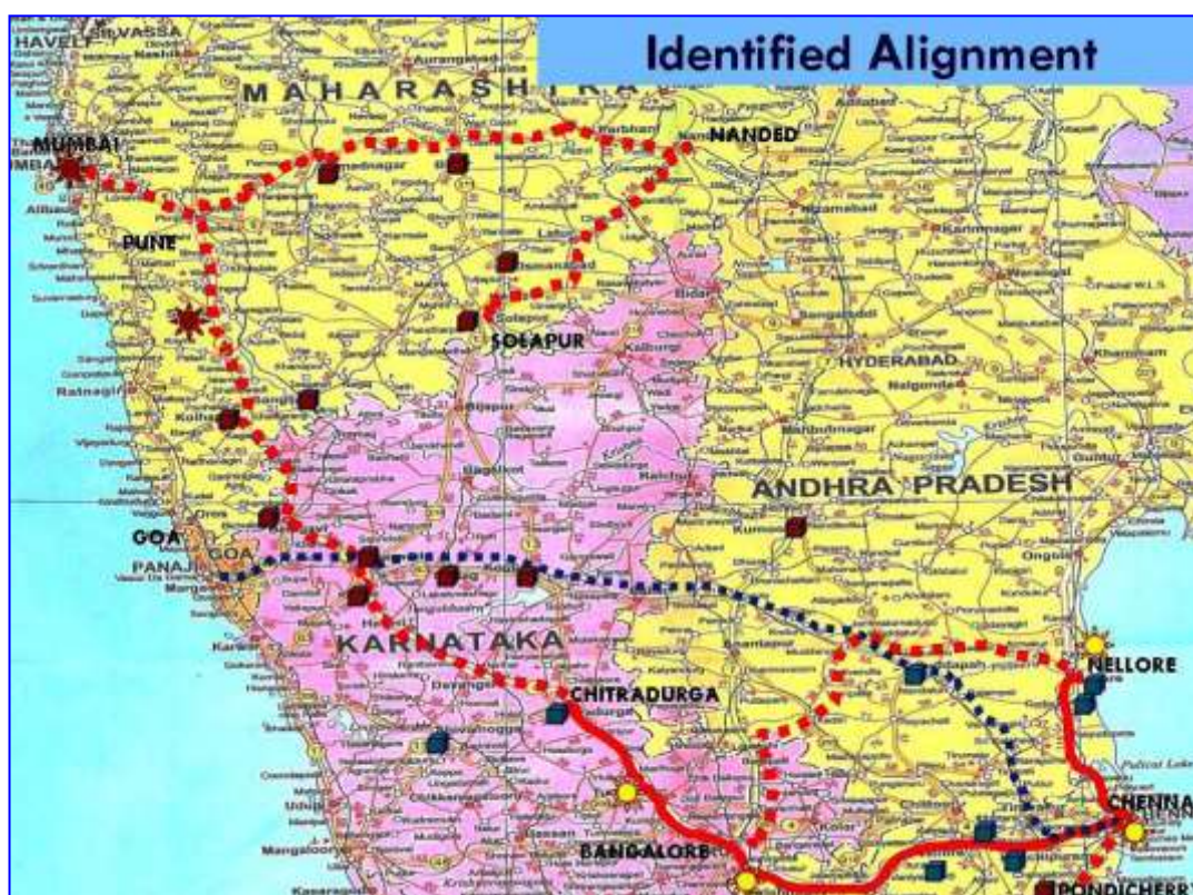
<地図1 南部インド産業回廊(PRIDE Corridor)>