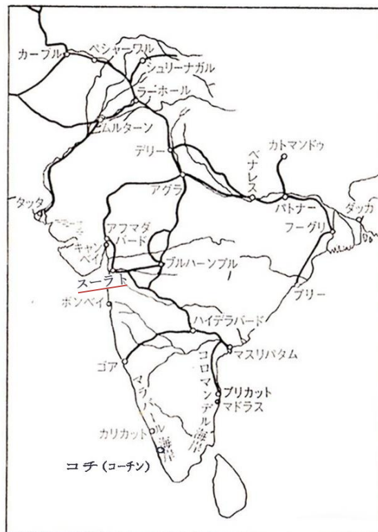
17世紀インドの主要交通路とスーラト

ポルトガル（1500-1663）支配下のケーララのコチ（コーチン）はコスモポリタンな都市であったように見なされたが、ポルトガル人や他のヨーロッパ人の居住区と現地のラージャ（王）やユダヤ人、ムスリムの居住区とに大きく2区分されていたし、その後オランダの支配下にはいった後も住民の流動性や統合性はスーラトより低かった。