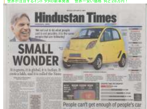
翌日の新聞（全ての新聞が1面トップで報道）

ナノの発売は今年10月ですが、発表から2ヶ月が経ちその評価と期待は高まっているように思います。インドのみならず世界の自動車業界に大きなインパクトを与え、世界中で低価格車の開発競争が激化することは間違いないと思います。参考までですが、インドのガソリン価格はリッター当たり約45