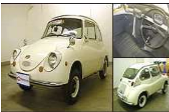
↑ 50年前の1958年(昭和33年) 発売のサブアル 360 エンジン360cc

要は、スズキのマルチ800（インドのベストセラーカー）や日本の軽自動車と比べて、全長こそ少し短いのですが、外観や基本仕様は似ています。もちろん内外装・安全装備などの仕様はマルチ800が優れています。しかし多くの人が懐疑的であった10万ルピーというマルチ800のほぼ半額という価格は、リキシャ（三輪タクシー車）の価格が15万ルピー、二輪オートバイが5万から6万ルピーといインドでは衝撃的でした。インド国内の安全基準や環境基準は当然満たしているわけですが、少しの手直しで欧州などの厳しい基準にも対応できる（タタの声明）という基本性能の高さや優れたデザインには世界中が驚いたと思います。