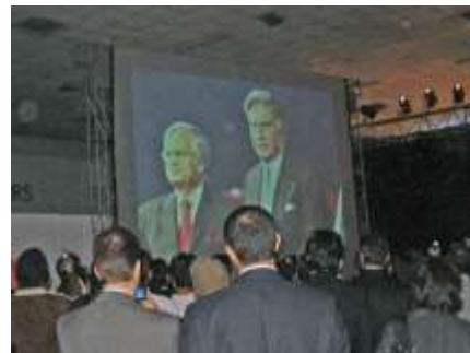
世界が注目するインドタタの新車発表 世界一安い価格 何と28万円!