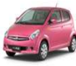
↑ スバルの最新軽自動車 R1 エンジン365cc