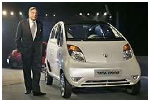
会場でナノを紹介する ラタン タタ 会長