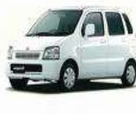
↑ 日本のベストセラーカーの 一つ スズキ ワゴン R エンジン 650cc