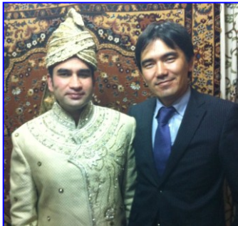
〈右が筆者、左はデリーでの同僚(カシミール出身)〉

私はこの経験を生かして、インドでがんばっている日系企業の皆様のお手伝いを、これからもさせていただきますと考えております。今後ともよろしく申し上げます。