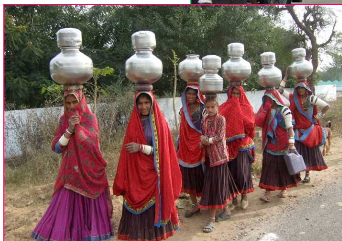
〈 新旧女性像 上:携帯電話を使うデリーの女性 下: 水瓶を運ぶラジャスタンの女性〉