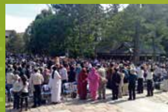
2014年5月 東大寺中門前にてカタカリ舞踊奉納