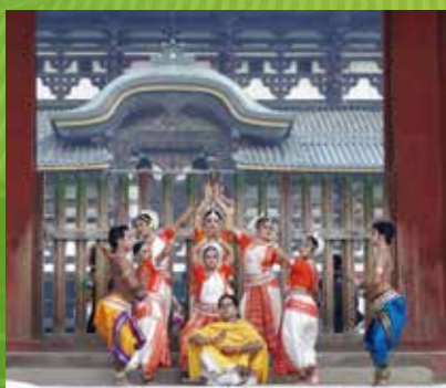
2012年5月 東大寺中門前にてヌルッティヤヤン Nrutyan オリシシー舞踊奉納