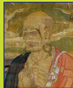
菩提僊那 (四聖御影(重文・一部))

大仏を含め東大寺の建立には当時の日本の人口の半分ほどの人が延べで関わったと言われています。盛大な開眼の催事は現代と比較するならば、オリンピックの数十倍とも言えるのではないのでしょうか。その導師をつとめたインド僧の生涯は、私たち現代人にとって大きな感動を与えます。