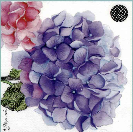
Lavender Blue Mixed media on Arches paper 2017 20 x 20 cm