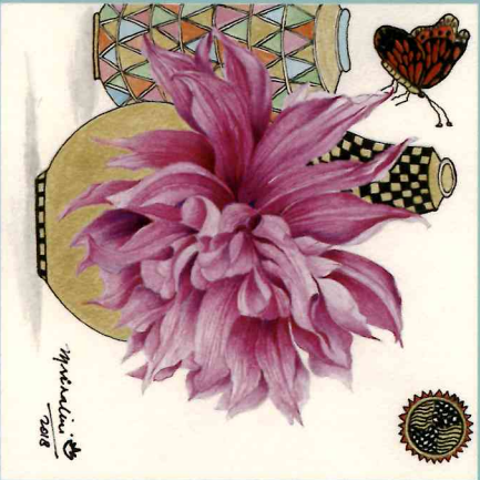
Clarity Mixed media on Arches paper 2018 20 x 20 cm