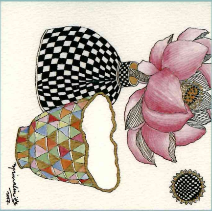
Tranquility Mixed media on Arches paper 2017 20 x 20 cm