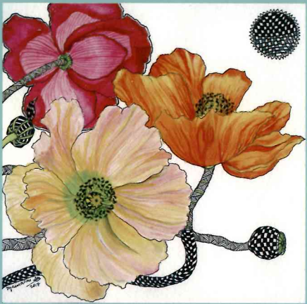
Perfect Harmony Mixed media on Arches paper 2017 20 x 20 cm