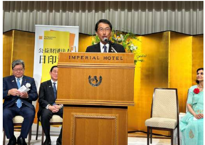
【小野啓一 駐インド日本国大使】