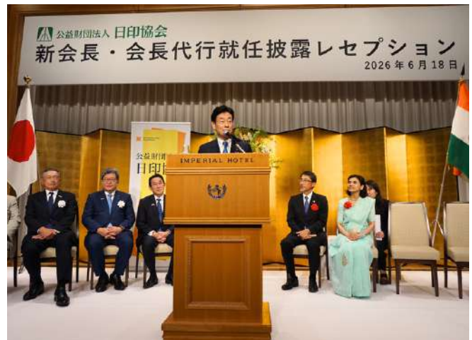
【西村康稔 日印友好議員連盟会長】