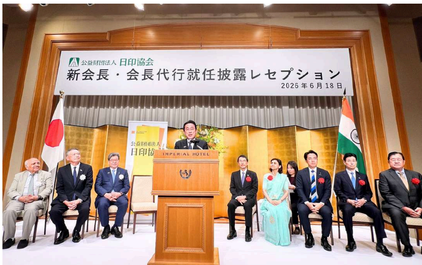
6月18日 新会長・会長代行就任披露レセプション