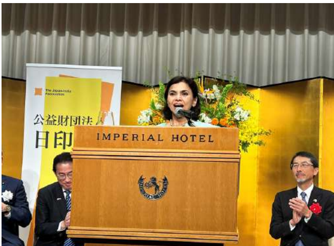
【ナグマ M マリック 駐日インド大使】