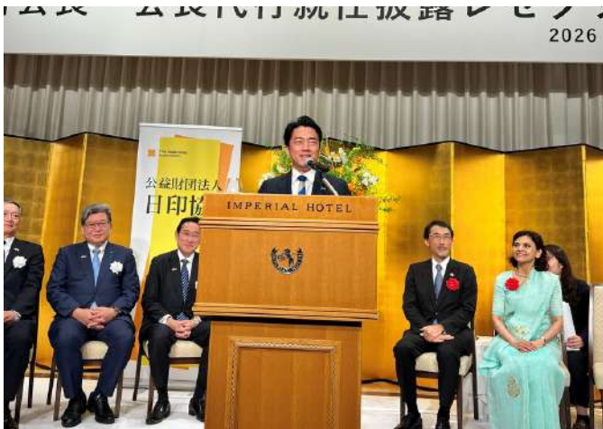
【小泉進次郎 防衛大臣】