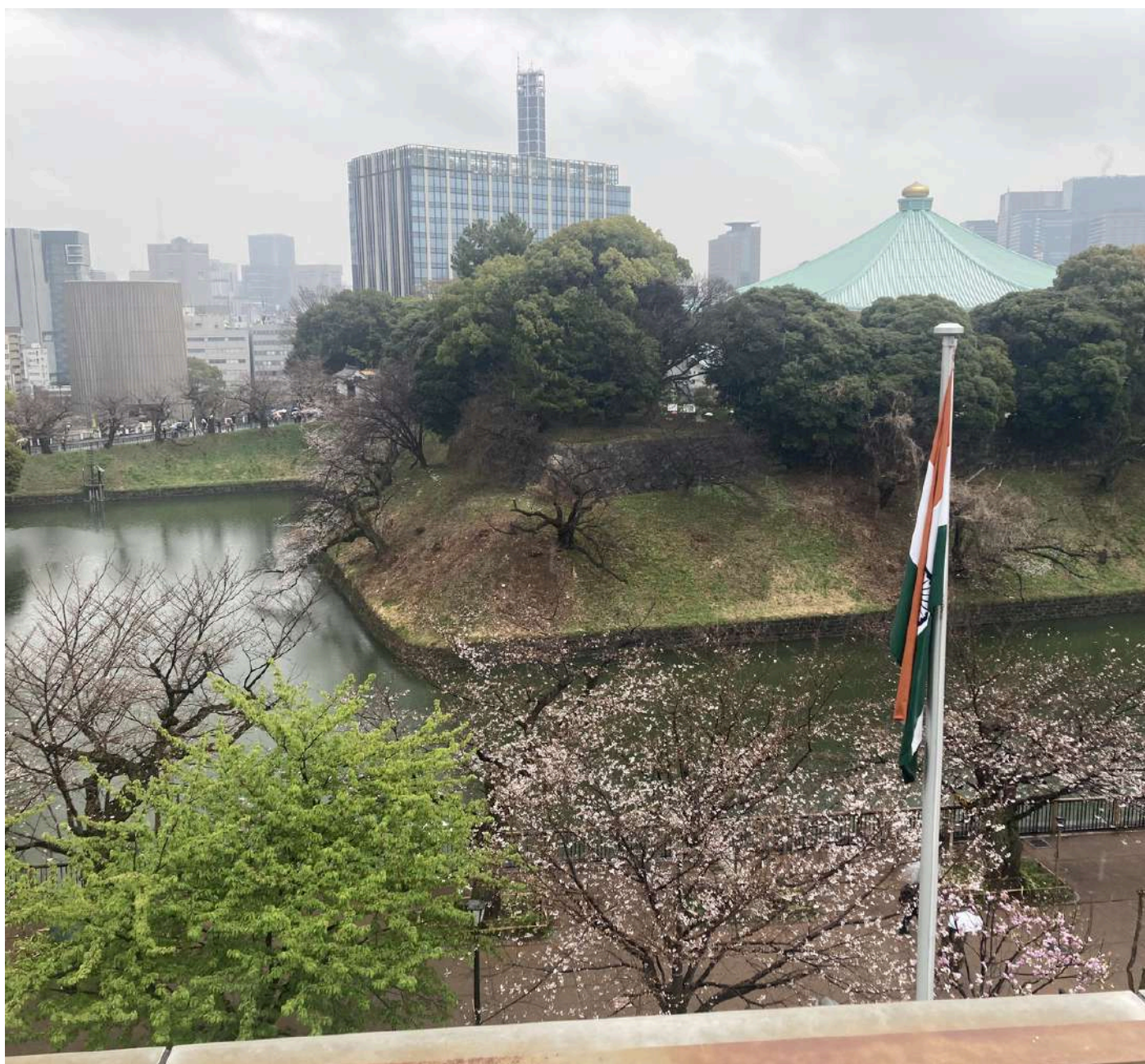
Hanami Reception 2026 駐日インド大使館から眺める桜雨