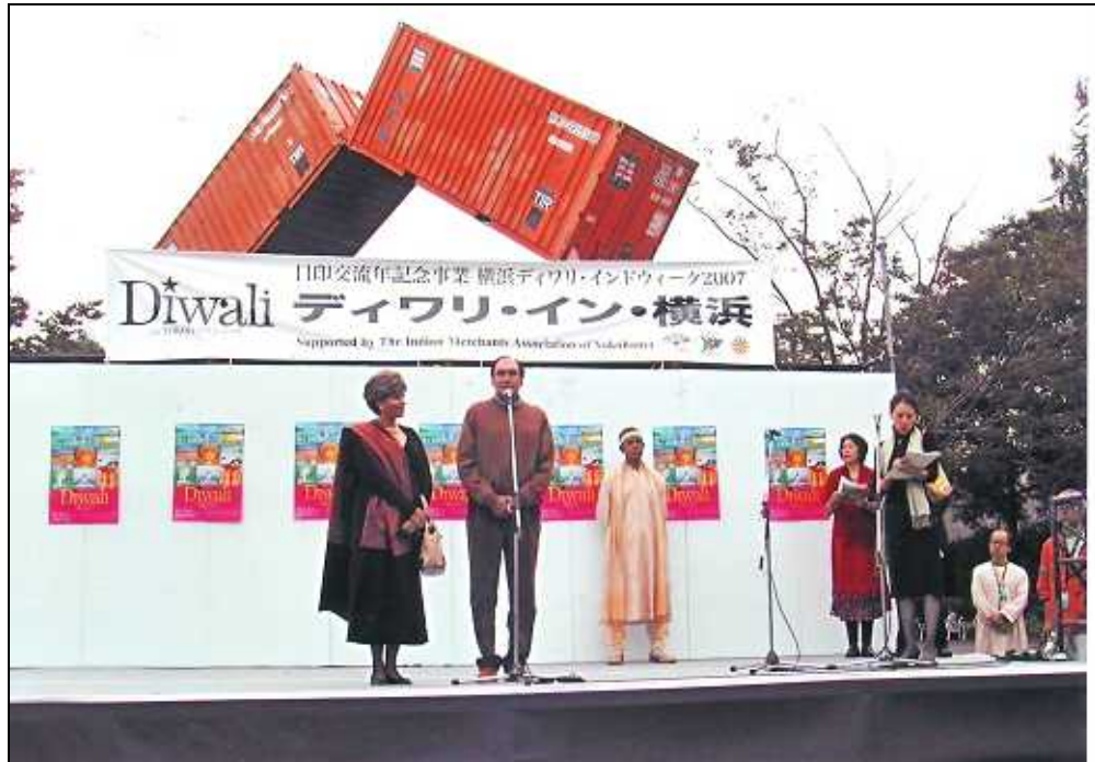
10月14日に行われた『Diwali in 横浜』での駐日シン大使ご夫妻のご挨拶