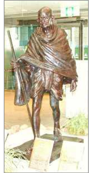
<ガンジー像>