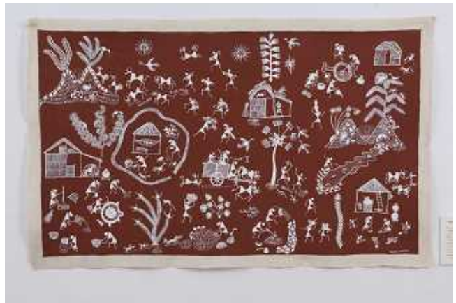
<ワルリ絵画 = 太陽神と村の1日>

写真の絵は、『太陽神と村の1日』を描いた1枚。朝、山の間から太陽神が顔を見せると、村の1番高い木のとっぺんにいる鳥が歌い始め(左上) その声を聞いた他の鳥たちも一斉に歓声をあげる。すると村人の家にいる鶏たちが鳴き、その声を聞いた人間は太陽神をお迎えするために身支度を整えて(左中央) 1日が始まる。日中は家事をしたり(左下) 狩り(上中央) や農耕(中央)、土木作業(下中央)などに出かける。