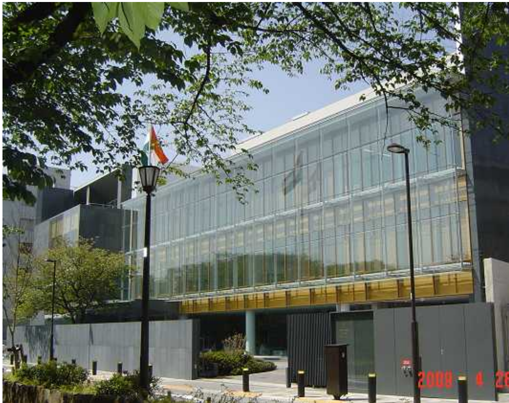
< 新築なった在京インド大使館 >