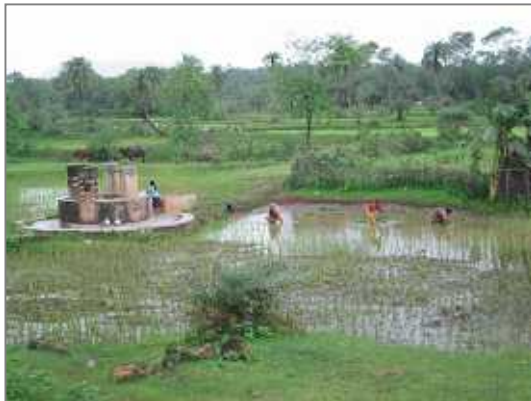
<ワルリ村の様子> 雨季には緑が溢れ 女性達がお喋りしながら手早く田植えをしていく

私がワルリの人々に初めて出会ったのは今から約 8 年前、学生 NGO のスタディツアーでワルリの人々の住む村を訪問したのがきっかけだった。人のつながりを大切に、自然と調和しながら生きるワルリの人々の生活は、忙しい都市に暮らす者の目には豊かで幸せなものに映ったが、その裏側には少数先住民族特有の歴史があった。