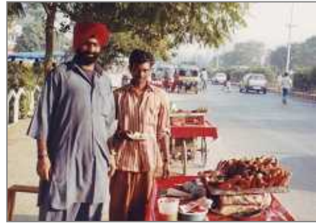
<パンジャブ地方の焼きイモ屋さん> ライムの汁をかけて食べる

インドと日本は、大陸では遠く隔てられていますが、海域ではモンスーン・アジア、海洋アジアの一環としてつながっています。また、雲南を源流とする照葉樹林文化帯においては東ヒマラヤと西日本とで東西の両端に位置付けられます。また、ユーラシア史の視点からは匈奴(フーナ)など北方遊牧民族の動きに直接・間接に影響され歴史的な画期が同軌していることもあります。勿論、仏教の伝播が最大のインドからの思想的・文化的インパクトであります。密教の中のバラモン教的要素も濃厚で、更には非仏教的要素の直接伝播も散見されます。シルク・ロードなど様々な海陸のルートによる伝播の過程でアジア各地の文化と習合・変容した要素が、縄文以来の土着文化と同化し日本文明の血肉となっている。この千年スパンのユーラシア諸民族による相互交流と綿々たる文化的リレーの営みに引き換え、昨今の IT に象徴されるグローバル化の波は何と一方的で皮相なものでありましょ。古代文明の伝播・受容・融合・変容・同化の過程にこそ、世界人類の共存と普遍的価値観の共有を希求する現代人に示唆するところ大なるものがあると信じます。