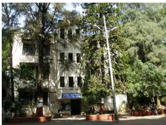
写真 学校の門の近くの風景

数日後、私は学校の門に近い花壇の縁に腰掛けて休んでいた。しばらくして初老の男性が白い杖をつきながら、門に近づいてきた。どうやら目が見えないようだ。門の近くは最近の道路拡張工事ですこぼこしていて、なかなか入れない。私はどうしようかと迷っていた。すると若い男性が通りかかり、何も言わずに盲人の手を引き、門の中へ入れてあげた。両者は「ありがとう」「いいえ」もなく別れた。初老の男性は次に建物の方へ向かう。しかしどの建物かわからない様子。すると一人の