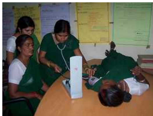
写真 1 「産前ケア」の実習風景 ANM が互いに血圧を測る

現場の実務者に光をあてる姿勢は、たしかに JICA の伝統かもしれない。私たちは受講者の任地にもでかけて彼らの職場を見て回り、改善策を話し合った。こうした方法は今まで無いと言われ、逆に悲しい思いがした。