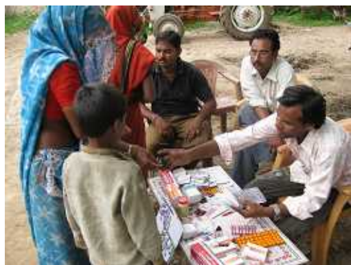
写真 2 村の保健・栄養の日 運営は保健省と女性子供省の協力で実施

NRHMの新戦略が出ると、JICAは先陣をきって現場で試験し、具体的な指針にまとめて州と共有する。研修教材、記録・報告様式、診療施設整備の指針、保健省と女性子供省が共同して毎月行う「村の保健・栄養の日」運営ハンドブックなどが、こうして現場と中央の往復運動の中で作られた。