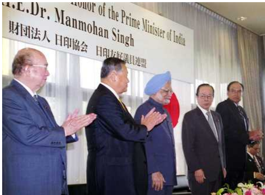
中山太郎 森喜朗 マンモハン・ 福田康夫 ヘーマント・K 日印友好議員連盟会長 日印協会会長 シン首相 日印友好議員連盟副会長 シン駐日大使